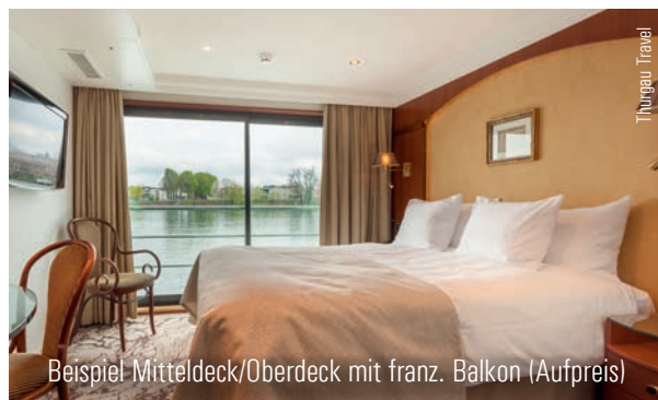
Beispiel Mitteldeck/Oberdeck mit franz. Balkon (Aufpreis)

Ausschiffung, Besuch des Basler Münster, dem bekanntesten Wahrzeichen der Stadt. Heimreise nach Vorarlberg.