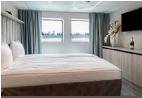
Kabinenbeispiel Hauptdeck vorne