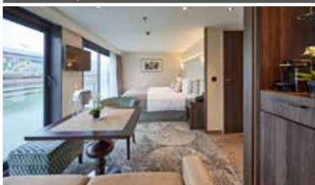
Kabinenbeispiel Oberdeck MASTER-SUITE

Die MS JOY der Schweizer Reederei Scylla ist ein elegantes First-Class-Hotelschiff, das modernen Komfort mit stilvollem Design verbindet. An Bord erwarten Sie helle, großzügige Gesellschaftsräume, ein Panorama-Restaurant mit Blick auf die vorbeiziehende Donau und eine gemütliche Lounge mit Bar, ideal für entspannte Stunden. Für Erholung und Aktivität sorgen der Wellnessbereich und der Fitnessraum.