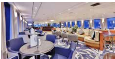
Lounge / Barbereich

Die MS GLORIA ist ein komfortables First-Class-Hotelschiff, das eine warme, elegante Atmosphäre mit klassischem Flusskreuzfahrt-Charme verbindet. Die Außenkabinen sind hell, freundlich und komfortabel eingerichtet und bieten Platz für eine überschaubare Anzahl von Gästen, was eine persönliche und angenehme Atmosphäre an Bord gewährleistet. Alle Kabinen verfügen über ein eigenes Bad mit Dusche/WC, individuell regulierbare Klimaanlage, TV, Safe und Telefon. Die Kabinen auf dem Mittel- und Oberdeck sind mit französischen Balkonen (zu öffnen) ausgestattet. Die Kabinen auf dem Hauptdeck verfügen über Fenster, die aus Sicherheitsgründen nicht zu öffnen sind. Zum Hauptdeck führen 6 Treppenstufen hinunter.