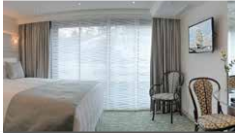
Kabinenbeispiel Mitteldeck SUITE