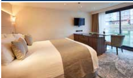
Kabinenbeispiel Oberdeck SUITE