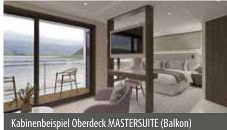
Kabinenbeispiel Oberdeck MASTERSUITE (Balkon)

Die MS RIVIERA RESPLENDECE wird im Herbst 2026 fertiggestellt und setzt neue Maßstäbe im Bereich moderner Flusskreuzfahrten. Das erstklassige Boutique-Hotelschiff verbindet zeitgemäßen Komfort mit stilvollem, lichtdurchflutetem Design. Alle Kabinen auf dem Mittel- und Oberdeck verfügen über französische Balkone (Mastersuite mit Balkon). Kabinen auf dem Hauptdeck verfügen über Fenster, die nicht zu öffnen sind. Zur Ausstattung gehören ein individuell regulierbarer Klimaregler, eine Nespresso-Maschine, Flachbildfernseher, Safe, Minibar sowie luxuriöse Badezimmer mit Dusche und WC. Die Kabinen verbinden modernes Design mit Funktionalität und bieten damit ein behagliches, elegantes Ambiente für jeden Gast.