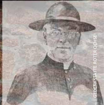
GEDENKSTÄTTE ROTER OCHSE