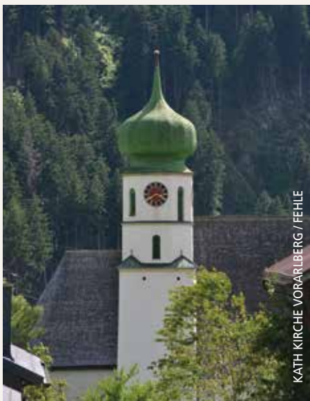
KATH KIRCHE VORARLBERG / FEHLE

Mittwoch, 2. Juli 2025 mit Werner Gerold